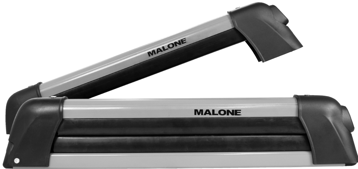
CARRIERS (1 PAIR)